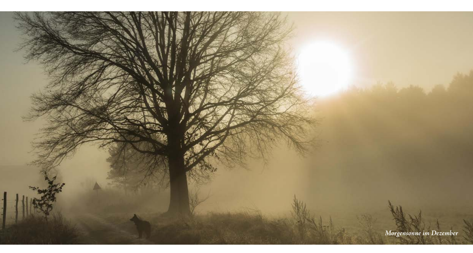
Morgensonne im Dezember