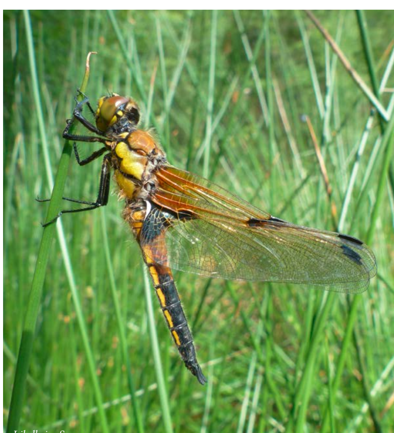
Libelle im Sommer