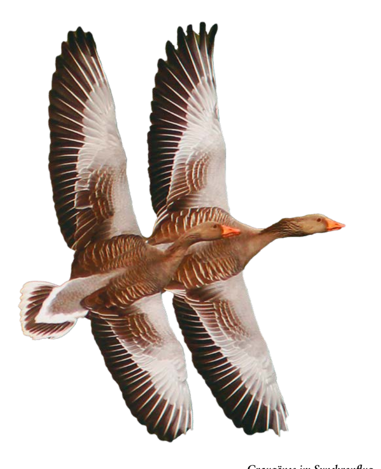
Graugänse im Synchronflug