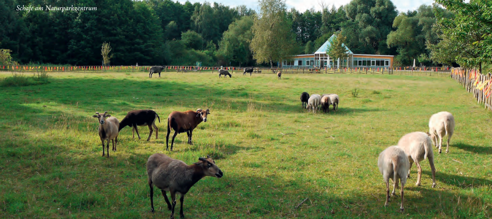
Schafe am Naturparkzentrum

Der Naturpark Nuthe-Nieplitz gehört zu den „Nationen Naturlandschaften“, der Dachreihe der deutschen Nationalparks, Biosphärenreservate und Naturparks. getragen von EU/OPARC Deutschland e.V.: www.europarc-deutschland.de