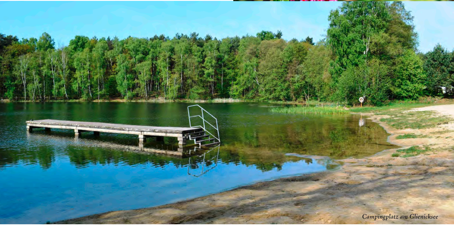
Campingplatz am Glienicksee