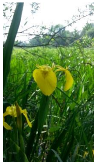
Bild oben: Gebänderte Prachtlibelle Bild rechts: Sumpfschwertlilie am Ufer

Die auf dem Gelände lebenden Knoblauchkröten führen eher ein verstecktes Dasein. Sie suchen zur Paarung die stark bewachsenen Bereiche im Wassergraben auf.