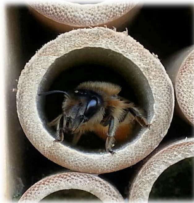
Bild oben links: Schwarzblaue Holzbiene Bild oben rechts: Sandbiene auf Weide Bild unten: Wildbiene in Nisthilfe

Innerhalb des Insektengartens gibt es Nisthilfen und Blumen mit tierischen Bewohnern und Besuchern zu bestaunen.