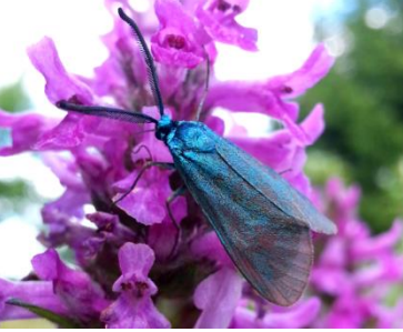
Bild oben links: Grünwidderchen, tagaktiver Nachtfalter Bild oben rechts: Kleiner Fuchs, Tagfalter

Ein Schwerpunkt ist der Insekten- und Vogelschutz. Hier möchten wir den Besuchern ökologische Zusammenhänge nahebringen und gerne auch zum Nachahmen im eigenen Garten ermuntern.